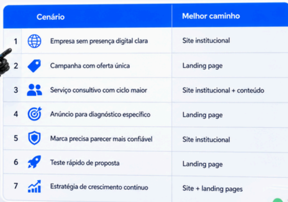
Tabela de decisão